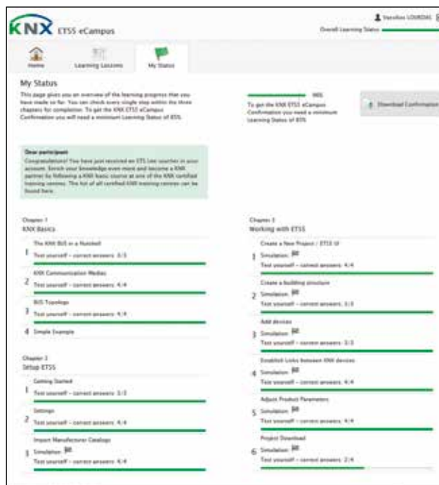
Διατηρήστε τα κίνητρά σας ελέγχοντας τον εαυτό σας στην εκπαιδευτική προόδο.

με εκείνη των συμβατικών συσκευών και καλωδιώσεων. Ωστόσο θα αναγνωρίσει γρήγορα το πόσο ευέλικτη είναι η τεχνολογία του προγραμματιζόμενου bus για επαναπροσαρμοζόμενες εφαρμογές. Ετσι, ακόμη και οι ασυνήθιστες απαιτήσεις των πελατών μπορούν να εκπληρωθούν. Αλλά πρώτα πρέπει να μάθει για την παραμετροποίηση των λειτουργιών της συσκευής – οι λεγόμενες τελευταίες πιελιές – έτσι ώστε οι ξεχωριστές συσκευές να εξελιχθούν σε ένα ολοκληρωμένο σύστημα αυτοματισμού. Τέλος, το πρόγραμμα φορτίζεται στα υλικά του δικτύου και το σύστημα τίθεται σε λειτουργία – τότε το έργο είναι πλήρες. Οσοι επιτύχουν επαρκή βαθμολογία κατά τη διάρκεια της αυτοαξιολόγησης θα λάβουν ακόμη κι ένα πιστοποιητικό -για εκτύπωση- αποδεικτικό στοιχείο για το αφεντικό, για τους πελάτες και φυσικά περαιτέρω KNX επαγγελματική εκπαίδευση.